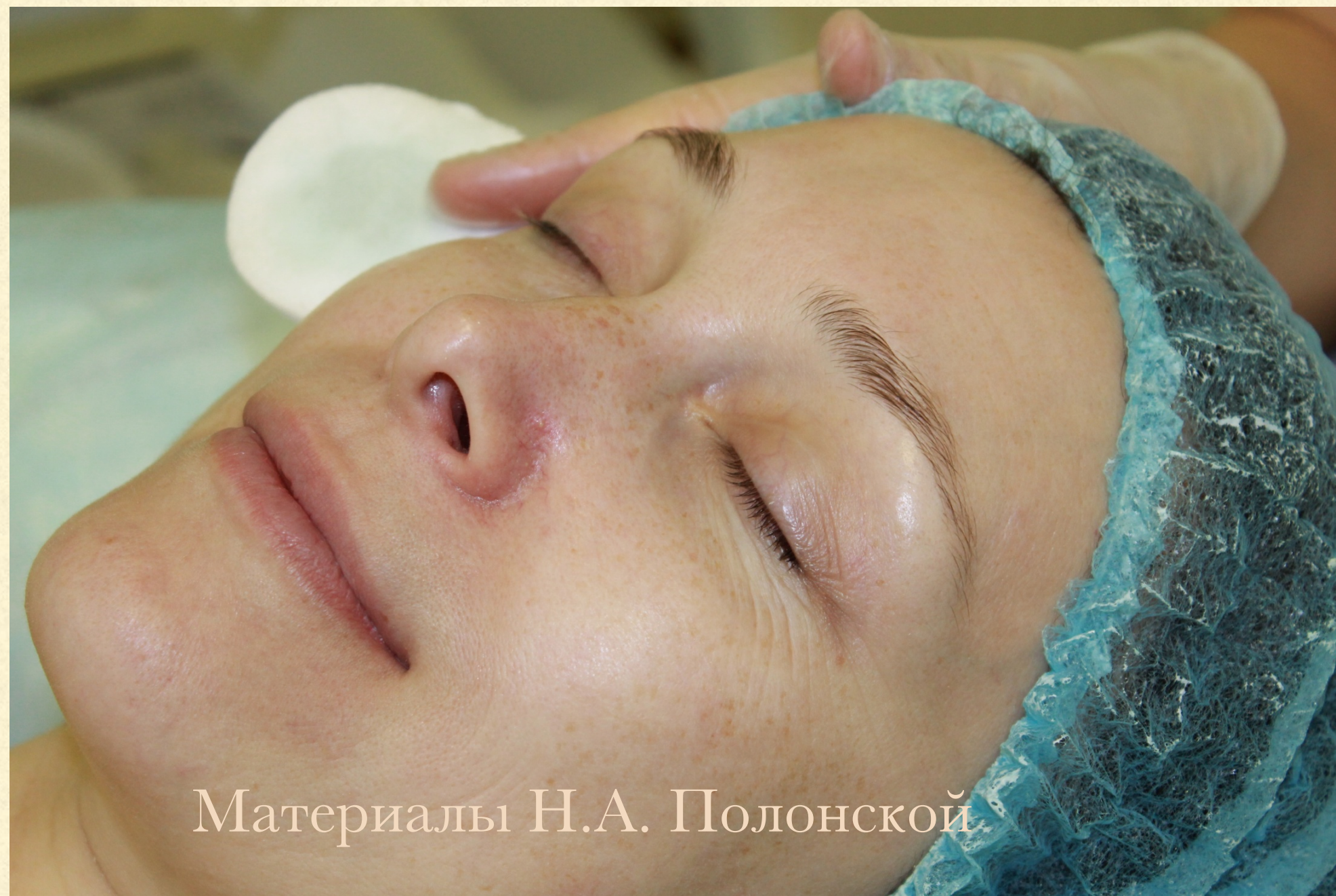
Материалы Н.А. Полонской

В завершение процедуры нанесите на лицо, шею, декольте, плечи, руки Ginseng&Carrot Cream следующим образом: возьмите небольшое количество средства, распределите его на подушечках пальцев и впитайте. Вы дадите коже ровно столько крема, сколько ей необходимо, не перенасыщая.