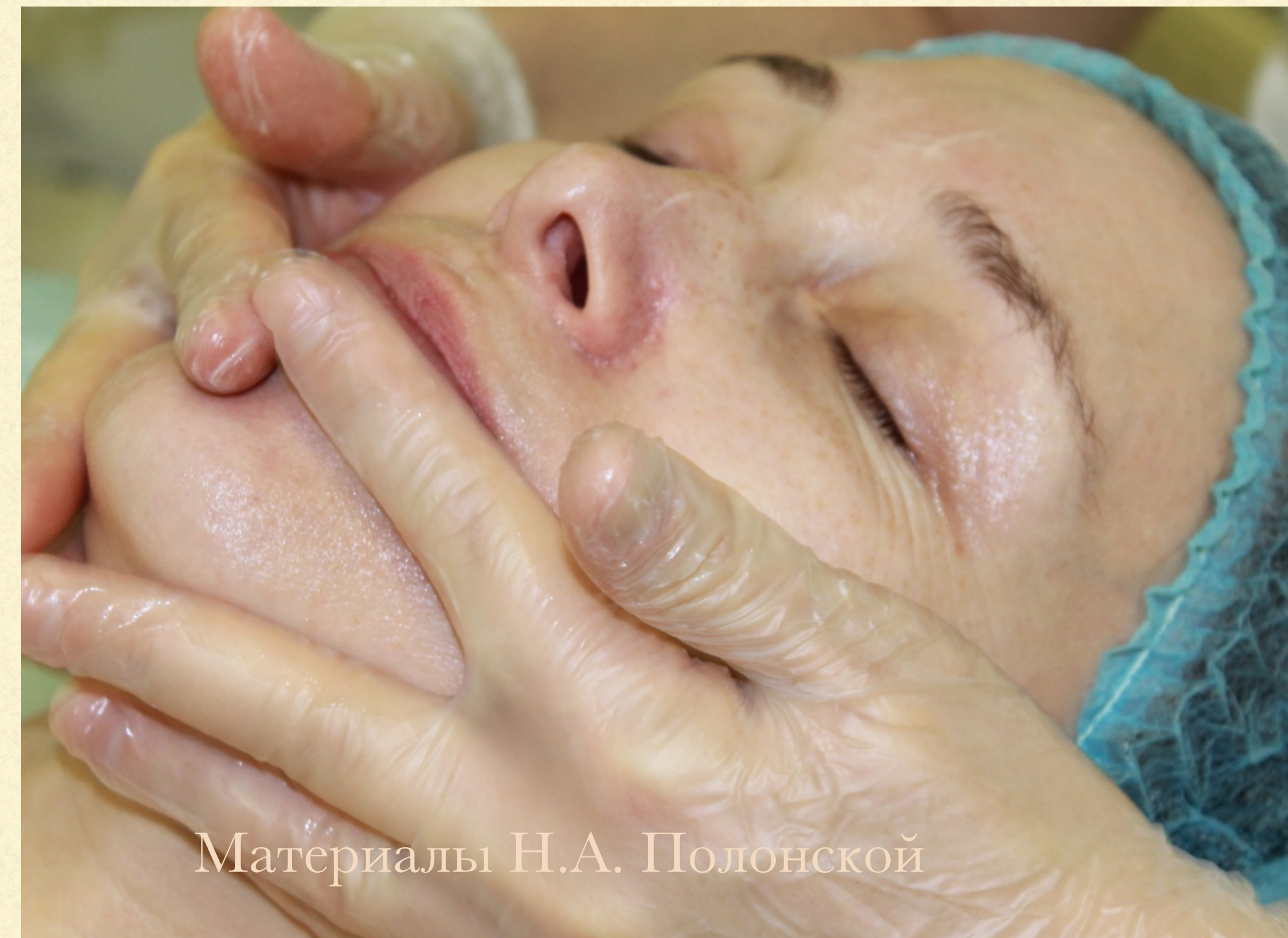
Материалы Н.А. Полонской